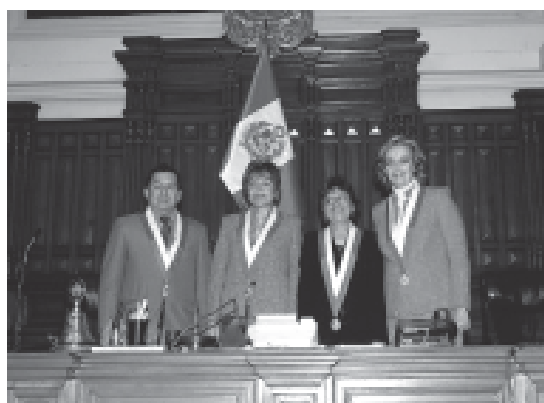
Mesa Directiva 2006-2007

En el nuevo Congreso, no bien proclamados los resultados, tres congresistas renun-